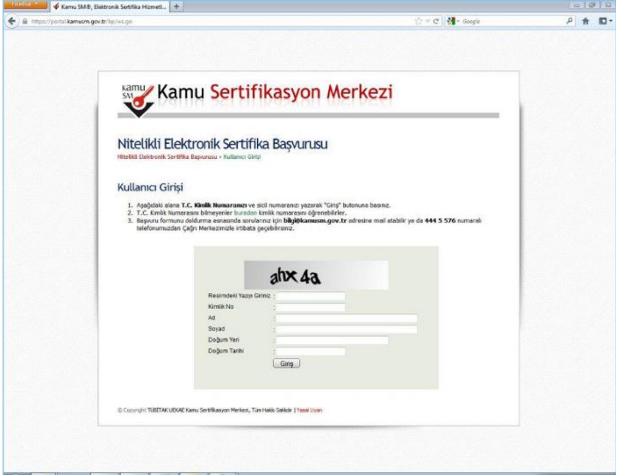
Şekil 1- Başvuru Portalı Giriş Ekranı

https://portal.kamum.gov.tr/bp/ws.go adresinden Şekil-1'deki Başvuru Portalı giriş ekranına ulaşılır.