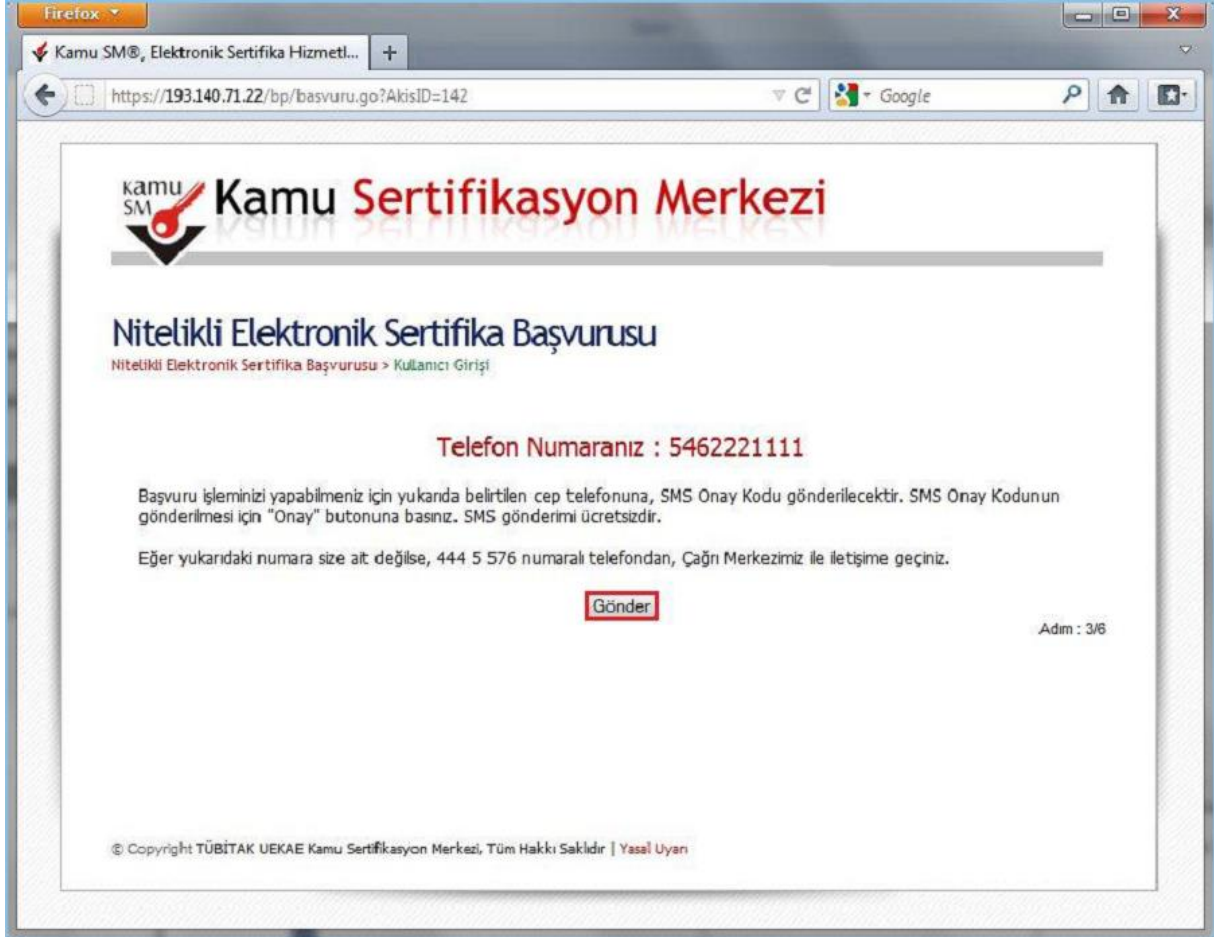
Şekil 3 - SMS Onay Kodu Gönderim Ekranı

Form onaylandıktan sonra SMS Onay Kodu gönderim ekranı (Şekil 3) görüntülenecektir. Başvuru formunu doldururken Cep Telefonu alanına girdiğimiz Cep Telefonu numarası görüntülenir. Gönder butonuna basıldığında ekranda görüntülenen cep telefonu numarasına SMS Onay Kodu gider.